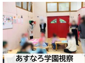
あすなろ学園視察

健康福祉部 保 育所等訪問支援、発 達相談、カンガル 一通園、巡回相談などを実施している。