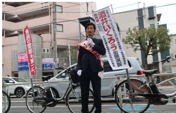
選挙カーを使わず選挙活動中

日曜深夜、戸田市議会議員選挙（2025 年 1 月 26 日執行）の結果が出ました（結果は裏面に掲載）。今回の市議選は、告示を前に長年議席を守り続けてきた有力議員が多数引退。25 人の定数に対して 33 人が出馬。派手なパフォーマンスもありましたが、それ以外の盛り上がりには欠けた選挙であったように思います。前回の戸田市議選以来、市外から多くの議員が立候補する「落下傘候補」の一大集積地となってきたこと、地方議会での事件とそれへのバッシングが続いたことで、地方議員を目指す人材が減少している、一般市民の関心が薄れているとの論評も聞かれました。そんな中で新人 6 人が当選し、議会の若返りを