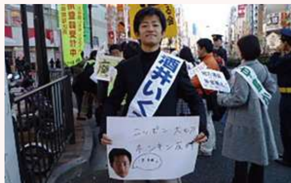
議員年金廃止デモ参加(2010)