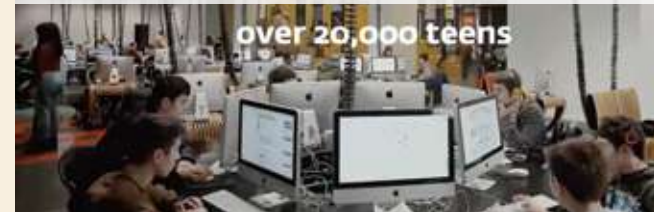
子どもたちが最新技術を無料で学ぶ ( https://tumo.org/ )