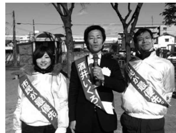
【休憩中の一枚。寒さの厳しい1週間、自転車に乗ってのお手伝い、本当にありがとうございました】