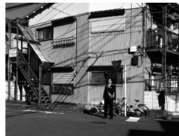
【市内の路地で演説中。自転車ですべて入って行って、政策をお話します】