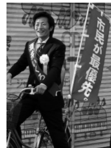
【市内遊説の移動中。移動は全て自転車です】

※ 会派について：新会派の結成を目指します。利権や特定団体とは無縁の、しがらみのない会派メンバーが集結し、市民の意思を実現すべく活動を行っていきたく考えています。