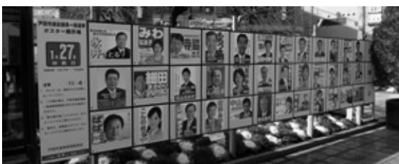
【戸田公園駅前のポスター掲示板。今回は立候補者が多いため、ずいぶん横長ですね。】